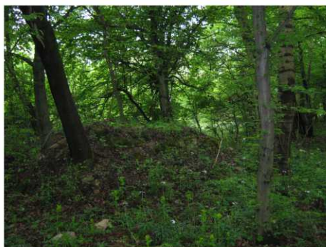
A vérteskozmai Szent Vendel kápolna romja 2011-ben

Évtizedekkel ezelőtt, a Vértes turista térképén, még Vérteskozma határában jelölték a Szent Vendel kápolnát. A 2006-es turista térképen már csak a Szent Vendel kápolnarom helye volt jelölve. A visszaemlékezők elmondták, hogy a kápolna 1945-ben az itt álló 3 hónapos háborút átvészelte és a hatvanas években hiányos bejárattal, cserepezéssel még állt, ahova az erdőjárók bemenekülhettek. 1969-ben a gondozatlan épület téglaboltozata összeomlott. Az ott hagyott hasznosíthatatlan épületmaradványt az erdő benőtte, derékvastagságú fák kapaszkodtak oldalában.