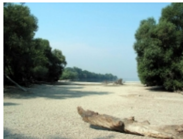
A nesz-mélyi Radvány-sziget

A LEADER+ Programban is sikeresen szerepeltek, egy kiadványt állítottak össze az Által-ér és a nesz-mélyi Radvány-sziget természeti kincseiről.