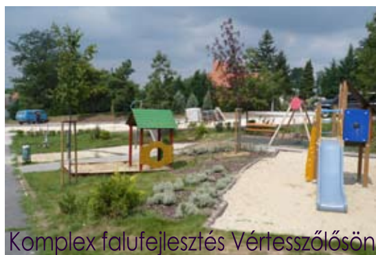
Komplex falufejlesztés Vértesszőlősön

A fejlesztés érintette még a helyi Művelődési Házat. Itt a tetőszerkezet került felújításra. A településen halad keresztül az 1. számú főút, melynek 1,5 km-es szakaszán új zöldfelület került kiépítésre a pályázaton elnyert összegből.