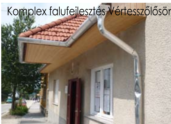
Komplex falufejlesztés Vértesszőlősön

Az Új Magyarország Vidékfejlesztési Program keretein belül a Vértesszőlős Község Önkormányzata által támogatásban részesült Naszály Község Önkormányzata. A település több mint 8 millió forint támogatási forrásból új kültéri közcélú játszótér hozhatott létre. A község a fejlesztés előtt nem rendelkezett olyan közcélú közösségi térrel, ahol a kisgyermek szabadidejében korszerű játékokkal játszhatna. A fejlesztés során fontos szempont volt a játszótér magába foglaló közpark megőrzése. A térre kihelyezésre került 2 db pad, 2 db hulladékgyűjtő és a terület közepére egy piknik garnitúrát helyeztek el, ezek mellett két kerékpártároló is beszerzésre került a pályázati forrásból. A madárfészek hintát, a kis csúszdát, valamint a rugós játékot tudják a mozgássérült gyermekek is biztonságosan használni. Beszerzésre került még „piruet” forgós hinta, mérleghinta, egy mászóka, valamint lépegető gombák.